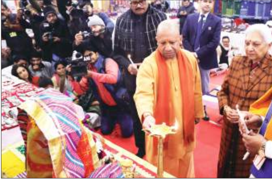
मिली। ये बातें मुख्यमंत्री योगी आदित्यनाथ ने शनिवार को कैसरबाग स्थित सफेद बारादरी में आयोजित ग्रामश्री एवं क्राफ्ट रूट्स की हैंडीक्राफ्ट प्रदर्शनी के उद्घाटन समारोह में कही।

टीम एक्शन इंडिया/लखनऊ हैंडीक्राफ्ट एग्जीबिशन देखने में भले ही छोटी लग रही है, लेकिन यह प्रधानमंत्री नरेंद्र मोदी के वोकल फॉर लोकल और आत्मनिर्भर भारत की आधारशिला है। प्रधानमंत्री नरेंद्र मोदी की प्रेरणा से प्रदेश में वर्ष 2018 में परंपरागत उद्योगों को प्रोत्साहित करने के लिए एक जिला एक उत्पाद का एक अभिनव कार्यक्रम शुरू किया गया। इसमें प्रदेश के सभी 75 जिलों के एक यूनिट प्रोड्यूसर का चयन कर उसकी मार्केटिंग की गई। इससे परंपरागत उद्योगों को एक नई दिशा और वैश्विक पटल पर पहचान